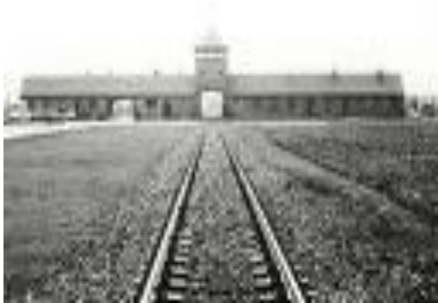
9. ročník ZŠ - Osvienčim

Občianske združenie "Rodičia a priatelia ZŠ Podvysoká" prispelo žiakom na výlety sumou 300 € (1,5 € na žiaka).