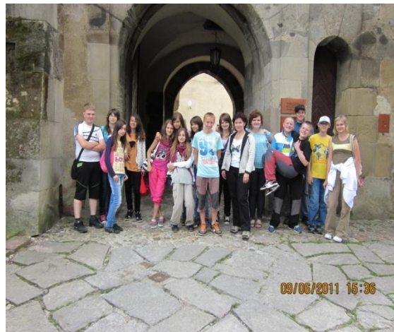
8. ročník ZŠ - Zvolen a okolie