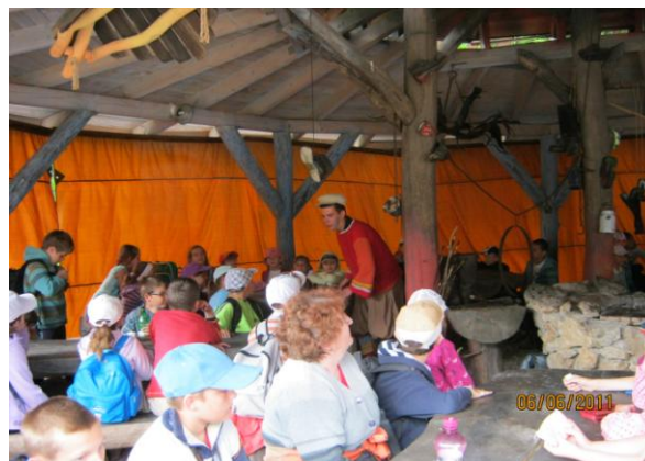
1. ročník - 6. ročník ZŠ Podvysoká - Donovaly Habakuky Dobšinského rozprávkový svet