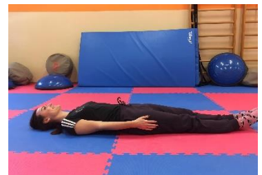
Ľah na chrbte