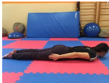
Ľah na bruchu