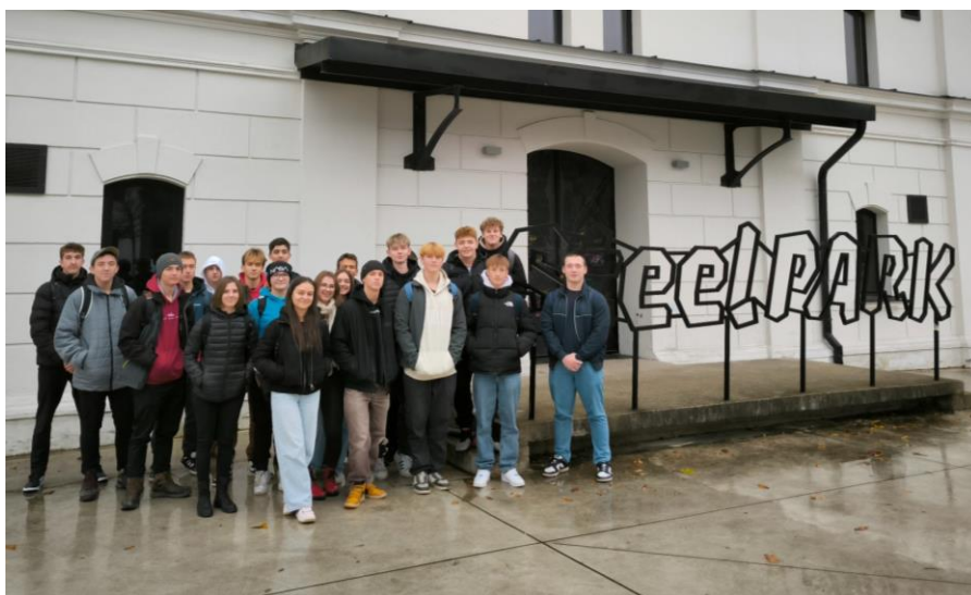
Obr.2: Spoločná foto