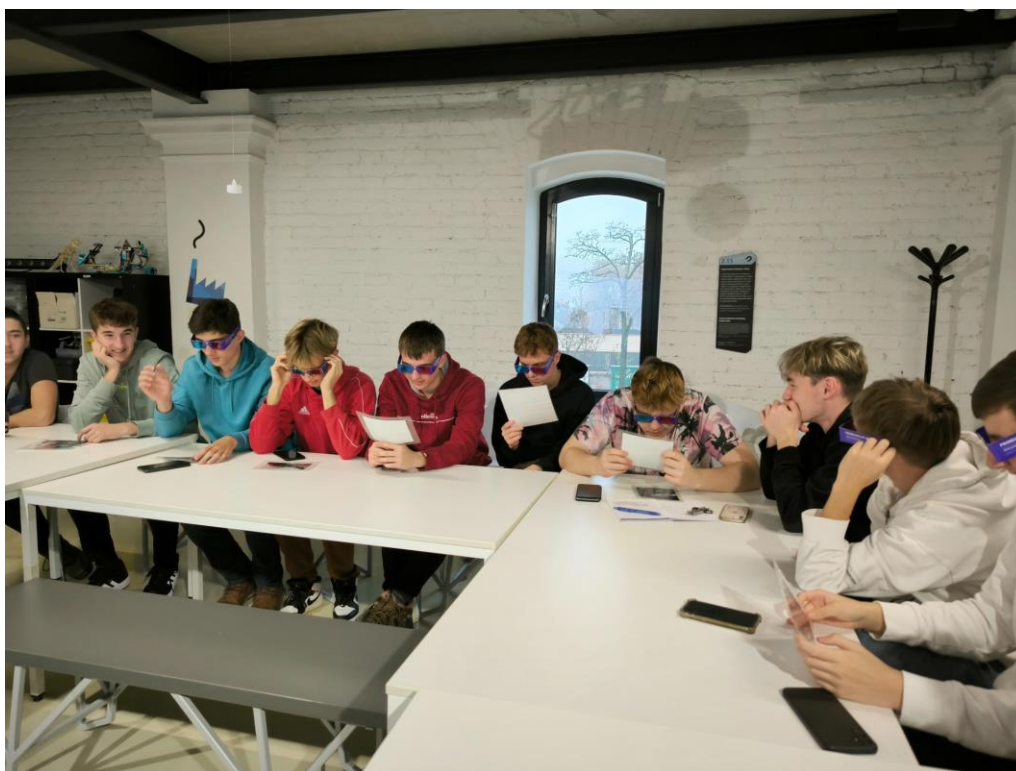
Obr.1: V laboratóriu – 3D okuliare

Posledné hodiny exkurzie sme spoločne prešli historické centrum Košíc nakoľko sa tam nachádza mnoho zaujímavých pamiatok.