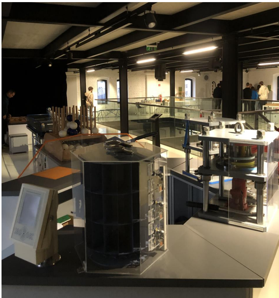
Obr.5: Jedno z 3 poschodí s expozíciou