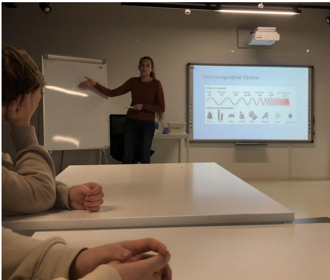
Obr.3: Prednáška o svetle