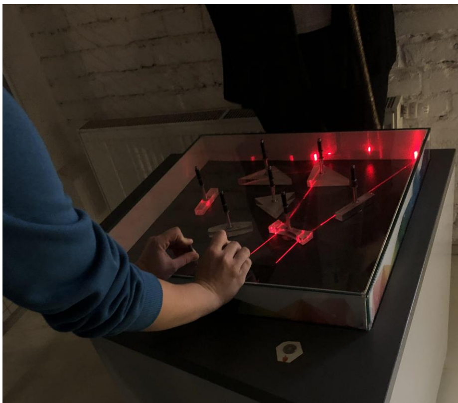
Obr.: Odraz a lom svetla