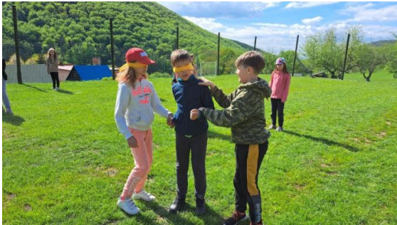
Slepá baba trošku inak...