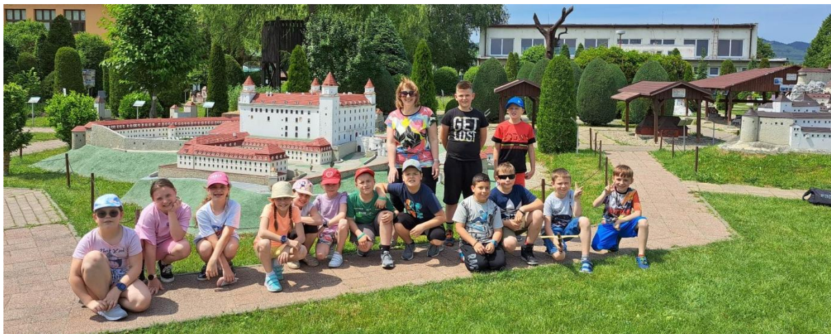
Štvrtáci a tretiaci s pani učiteľkami