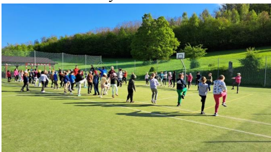
Ranné rozcvičky nás prebrali