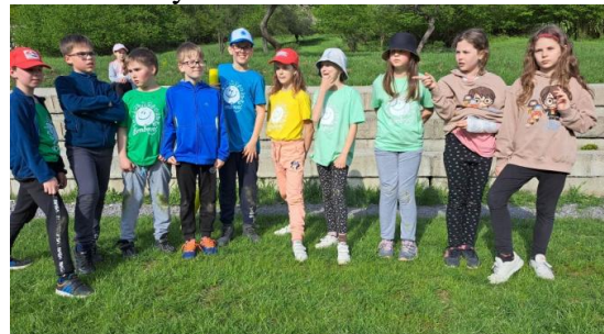
Kto má NAJšpinavšie kolená ?