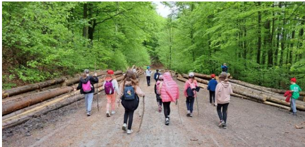
veľa sa prechádzali...