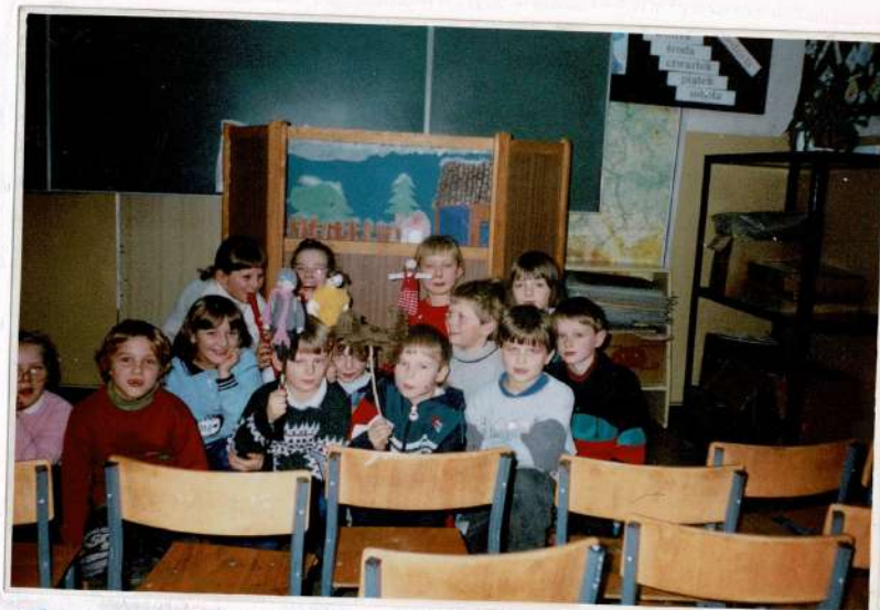
Teatrzyk kukielkowy „Kłopoty Burka z podwórka” przygotowała kl III b pod kierunkiem wychowawczyni Urszuli Wotowicz.