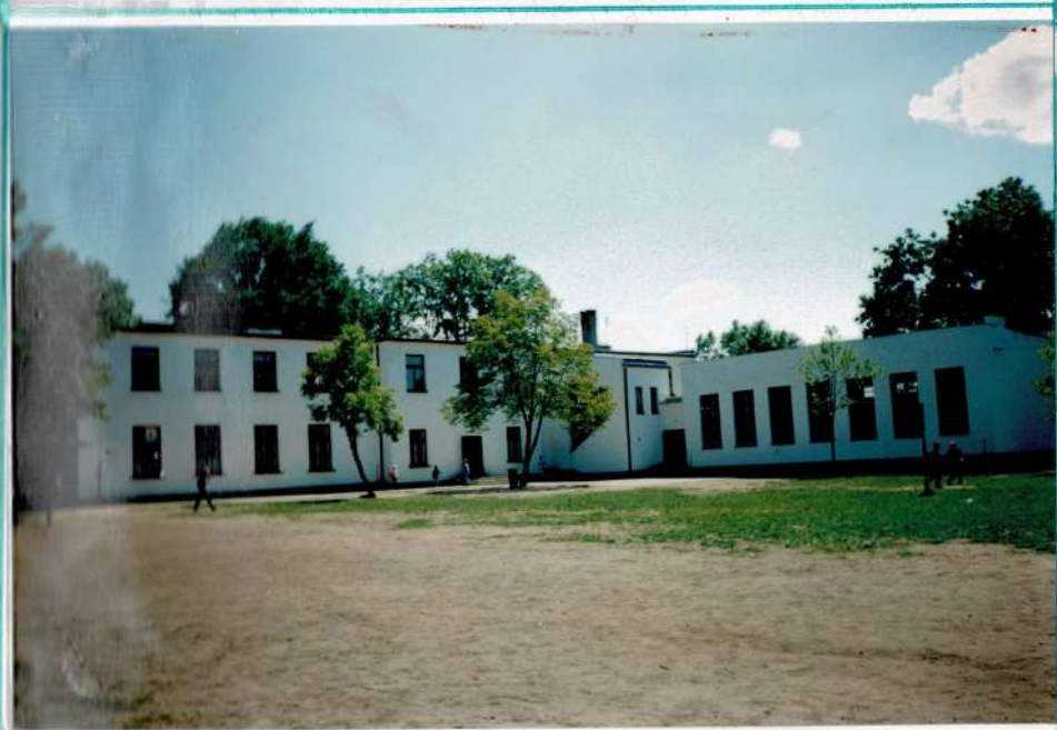
WIDOK SZKOŁY OD STRONY BOISKA