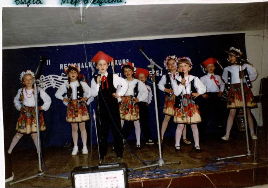
II Regionalny Konkurs Piosenki Dziecięcej w Bogutach.