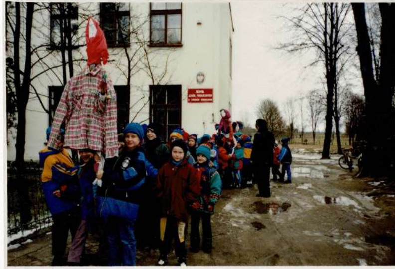
Obchody topienia Marnanny tradycyjnie organizowane w naszej szkole od wielu lat.