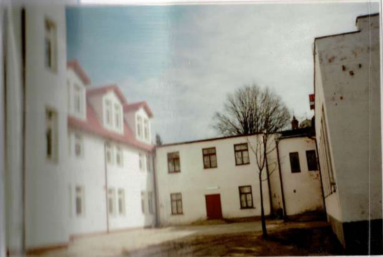
Tak wyglądała nasza szkoła w ostatnich dniach sierpnia. Widok od strony placu apelowego.