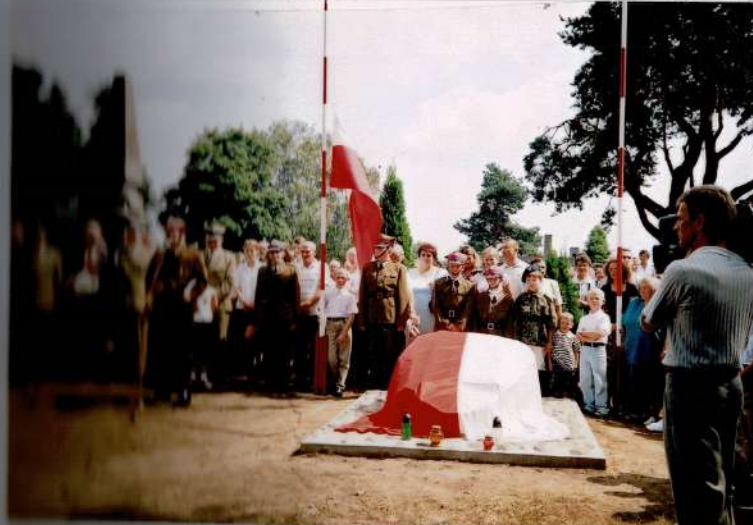
Uroczystości środowiskowa 15 sierpnia 2002 święto Wniebo- wzięcia NMP i wzniecia ludu nad Ništa.