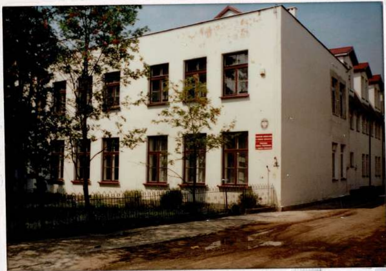
Widok szkoły od strony bramy.