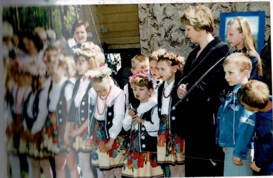
uczniowie występy na uroczystości środowiskowej.