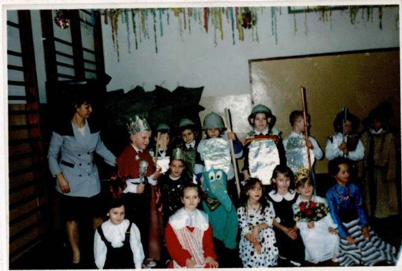
Prezentowanie "Ballada o uprzejmym rybczu" w wykonaniu klasy I b