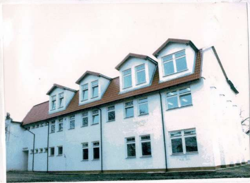
Widok szkoły od strony małego boiska.

obowiągi. Nauczyciele włożyli dużo pracy w opracowaniu bądź aktualizację dokumentacji szkoły: statut szkoły, program wychowawczy, roczny plan edukacyjny, wewnętrzny system oceniania. W klasach I-III zaczęła funkcjonować ocena opisowa. Na początku roku pan W. Pasek przeprowadził szkolenie na temat budowania WSO.