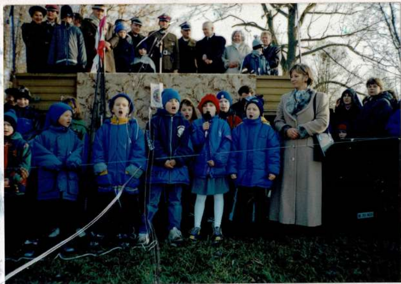
Klasa IIa wystąpiła z repertuorem patriotycznym na uroczystości z okazji święta Niepodległości.