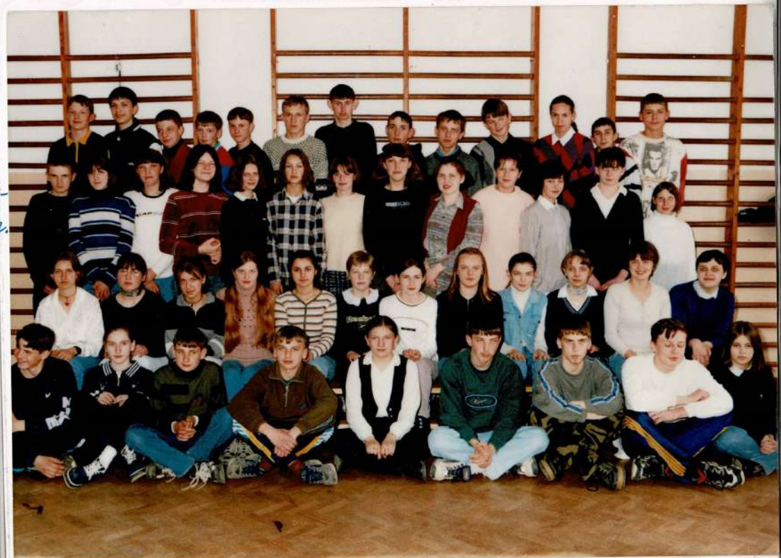
Pożegnaliśmy następną rocznik klas ósmych.

czystością i nowością na rozpoczęcie nowego roku szkolnego. Nie zdawano tylko z odnowieniem sali gimnastycznej oraz wyposażeniem szatni. Trwała budowa wyprzedażni ścieków. Teren wokół szkoły był porządkowany przez maszyny budowlane.