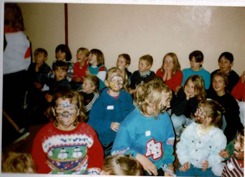
Atmosfera klas czwartych.