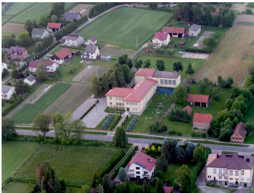
Teren szkoły z lotu ptaka

W ostatnich latach miały miejsce w szkole duże inwestycje i remonty: wymiana okien i drzwi zewnętrznych, budowa i remont dachów, termomodernizacja całego budynku i wykonanie nowej elewacji, remonty chodników i budowa nowych parkingów, uporządkowanie i odnowienie zieleni przyszkolnej, a także remonty podłóg i układanie nowych parkietów oraz wymiana większości mebli szkolnych. Dzięki projektom i środkom zewnętrznym szkoła została wyposażona w dwie nowe pracownie komputerowe i zestaw laptopów oraz tablice multimedialne, projektory i laptopy w każdej sali lekcyjnej, dwa monitory interaktywne, a także dużą ilość nowych pomocy dydaktycznych.