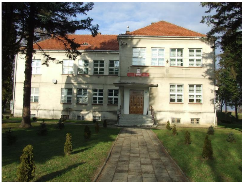
Nowa szkoła wybudowana w 1952 r. (foto z 2008 r. przed remontem)

W roku 1966 w Polsce świętowano Tysiąclecie Państwa Polskiego. Wkładem wsi w obchody rocznicy było m.in. rozpoczęcie rozbudowy szkoły. Komitet Rodzicielski pod przewodnictwem Kazimierza Wojtunia pełnił równocześnie funkcję Komitetu Rozbudowy Szkoły. Dzięki zaangażowaniu mieszkańców wsi, wsparciu komitetu opiekuńczego szkoły przy Zakładach Ceramiki Budowlanej w