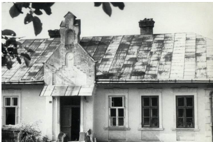
Dawna szkoła wybudowana w 1903 roku