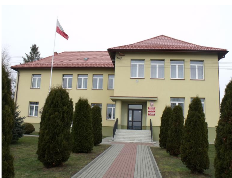
Obecny wygląd szkoły (foto z 2021 r.)