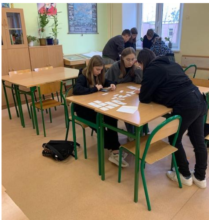
„Sprawdzian” z pojęć dotyczących bankowości.

Wizyta w Firmie Z.P.U Prawda SP. Z.O.O. Olecko, okazała się równie interesująca. Zwiedziliśmy halę, na której następuje ostatni etap produkcji, następnie na sali konferencyjnej przedstawiono nam historię tego zakładu. To było bardzo znaczące doświadczenie, dowiedzieliśmy się, że ten zakład w produkcji mebli z brzozy ma pierwsze miejsce w Polsce. Uświadomiliśmy sobie, że Olecko dzięki tej firmie bardziej jest znane w świecie niż w samym Olecku.