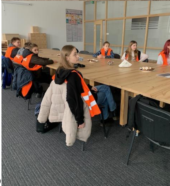
Prawda SP. Z.O