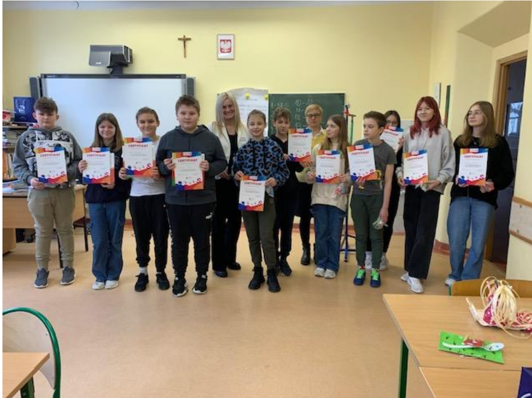
Najwytrwalsi i szczęściarze, których nie dopadła choroba