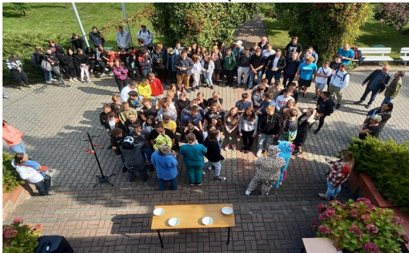
DZIEŃ CHŁOPAKA W NASZEJ SZKOLE!