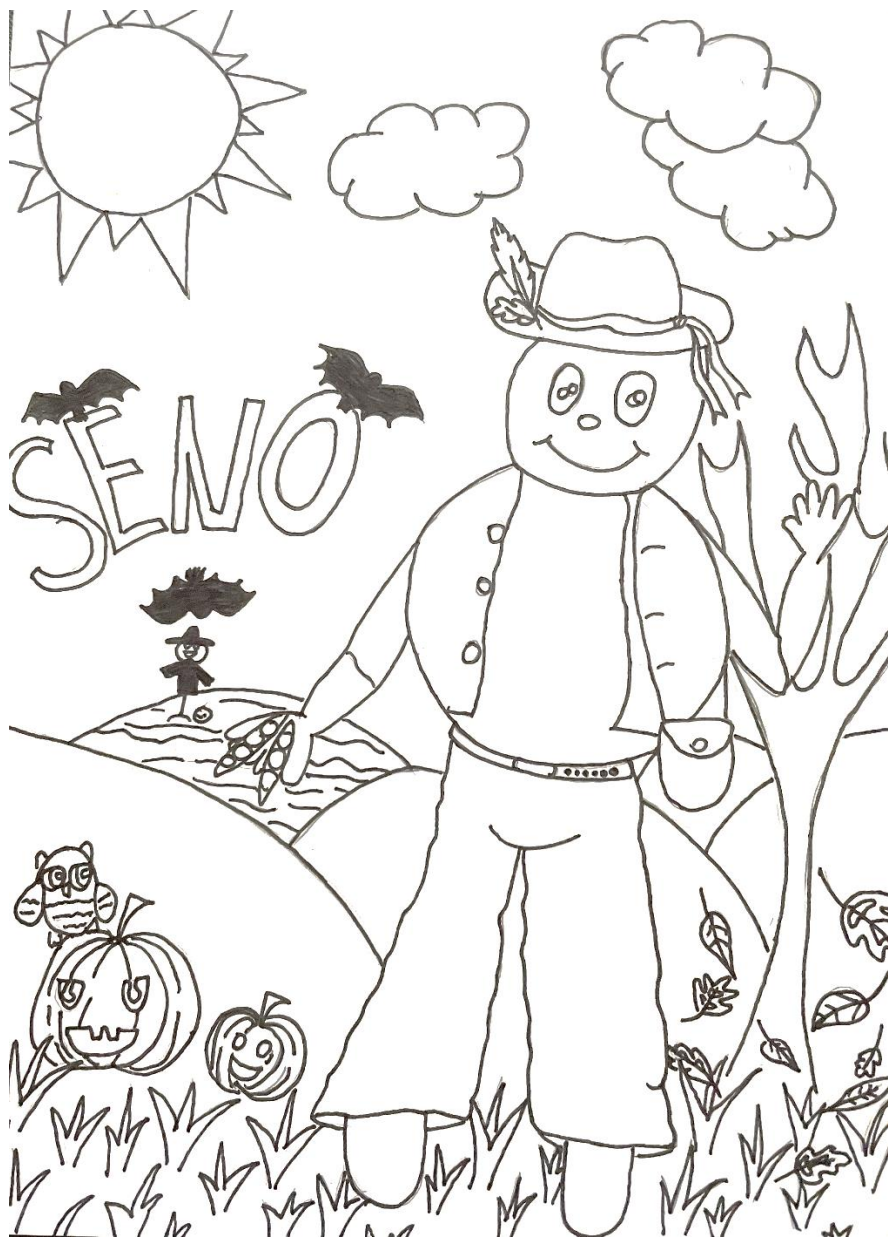
Ilustrácia : Vaneska Vaisová 5. ročník