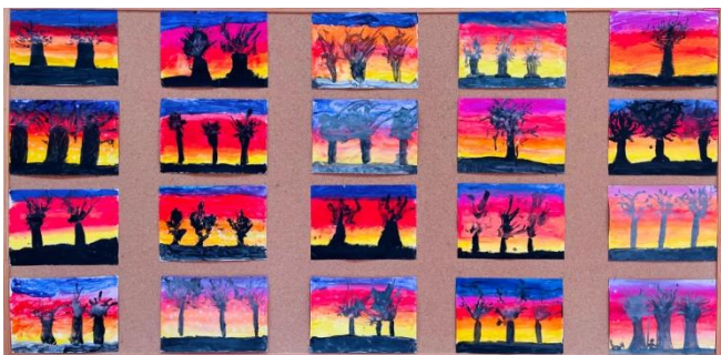
Praca plastyczna: „Listopadowe drzewa” kl. IIIc