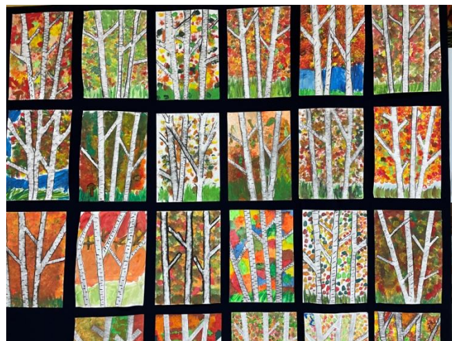
Praca plastyczna: „Jesienne brzozy” kl. IIIa