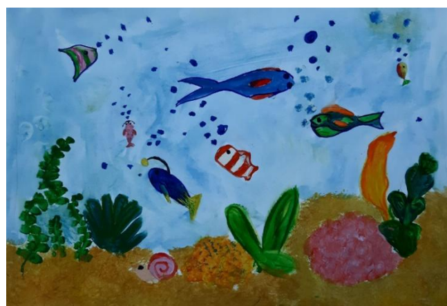
Pola Wądołkowska, kl. IVf