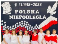
apel z okazji Narodowego Święta Niepodległości. Uroczystość dla klas młodszych