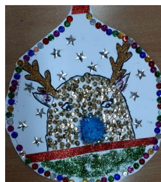
Wiktoria Konopka, kl. IVc