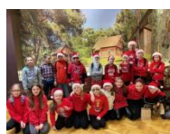
→ 4 i 5 grudnia klasa 3C i 3B świętowały mikołajki w Muzeum Północno-Mazowieckim w Łomży.