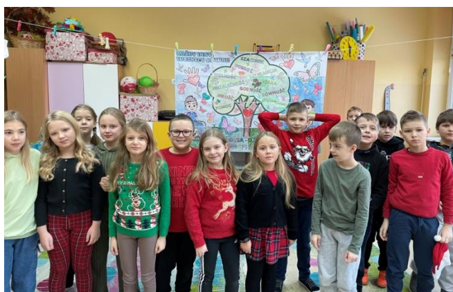
Plakat przygotowany przez klasę IIIb z okazji Międzynarodowego Dnia Osób z Niepełnosprawnościami.