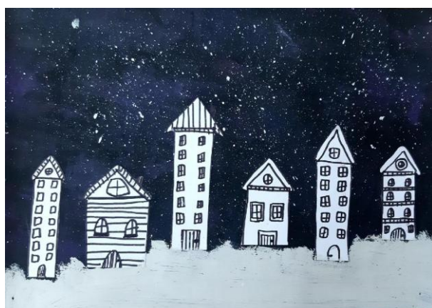
Natalia Włodkowska, kl. VIb