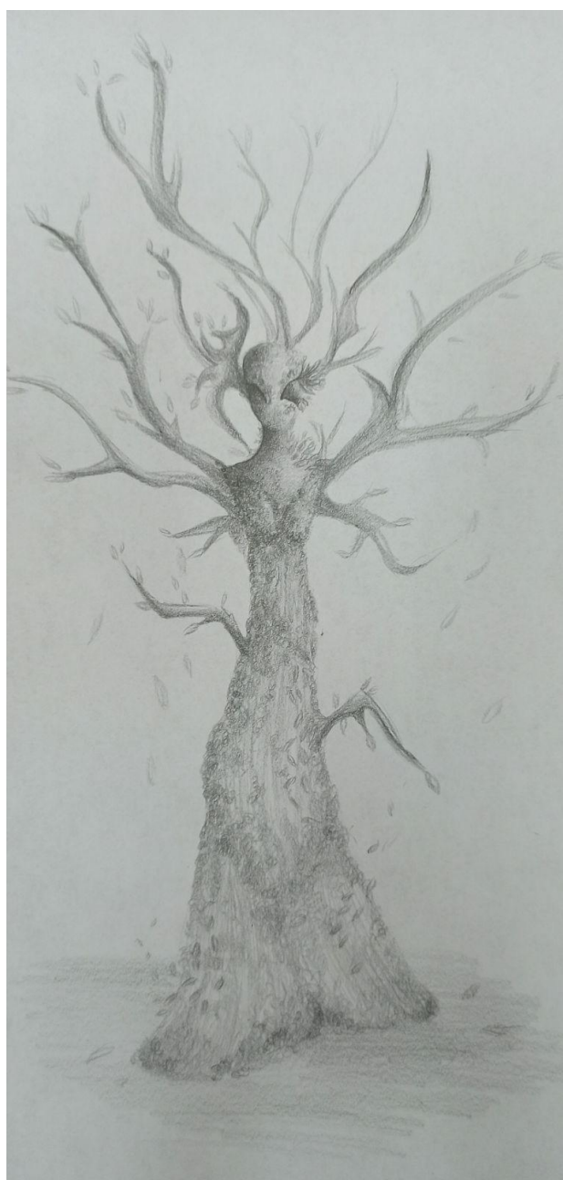
Oliwia Zduńczyk VIIa